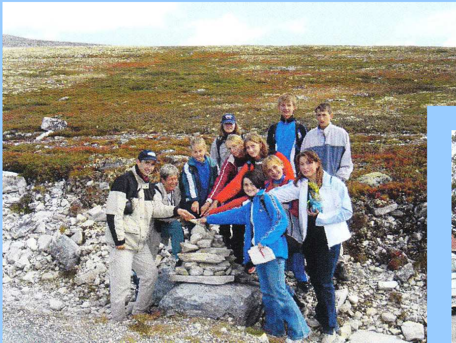
☛ Stavění tzv. „mužíka“