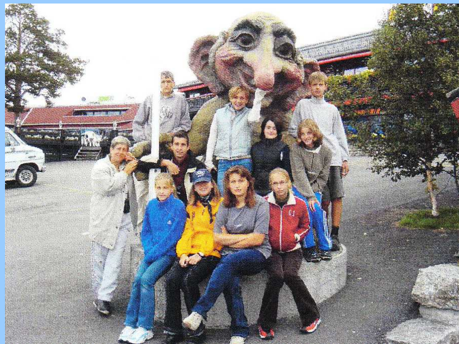
☛ Socha Trola před informační budovou