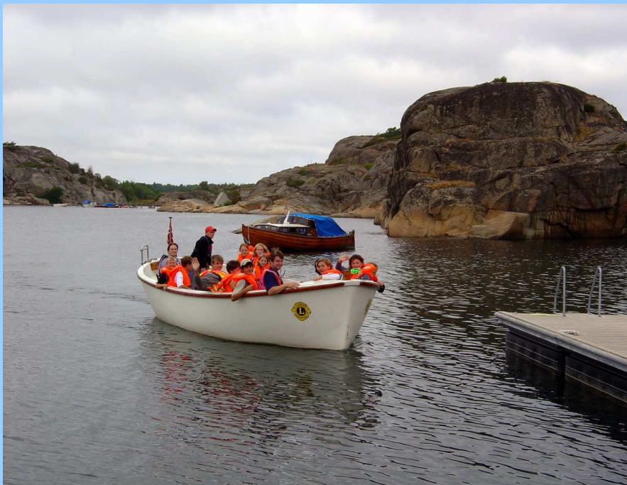
👉 Výlet na loďce