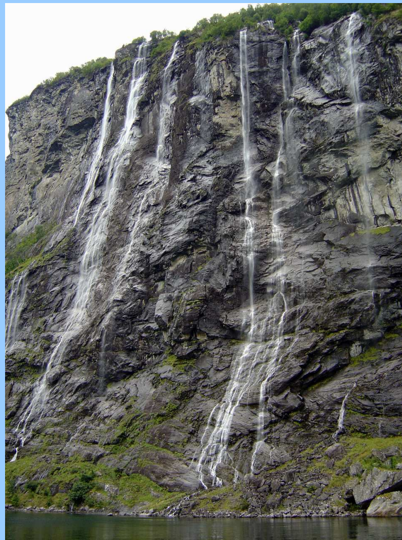
👉 Vodopád Sedm sester