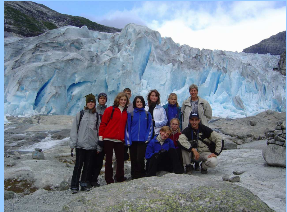
↳ Bystřická jedenáctka