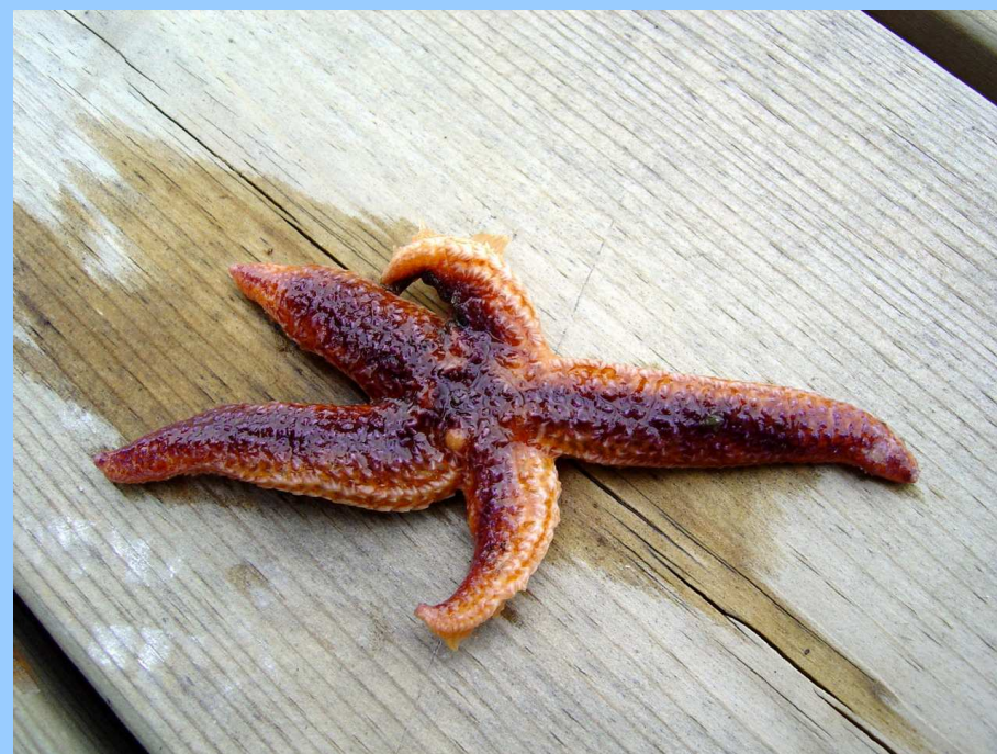
👉 Hvězdice červená